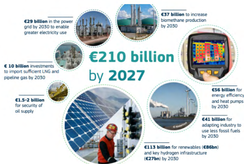
Figura 4. Finanziamenti di RePowerEU

La Commissione Europea ha indirizzato la sua prima raccomandazione 38 a conclusione del semestre europeo 2020 rispetto a misure da adottare prima e post COVID-19, invitando quindi dapprima ad adottare e attuare tutte le misure necessarie per affrontare efficacemente la pandemia, sostenere l'economia e la