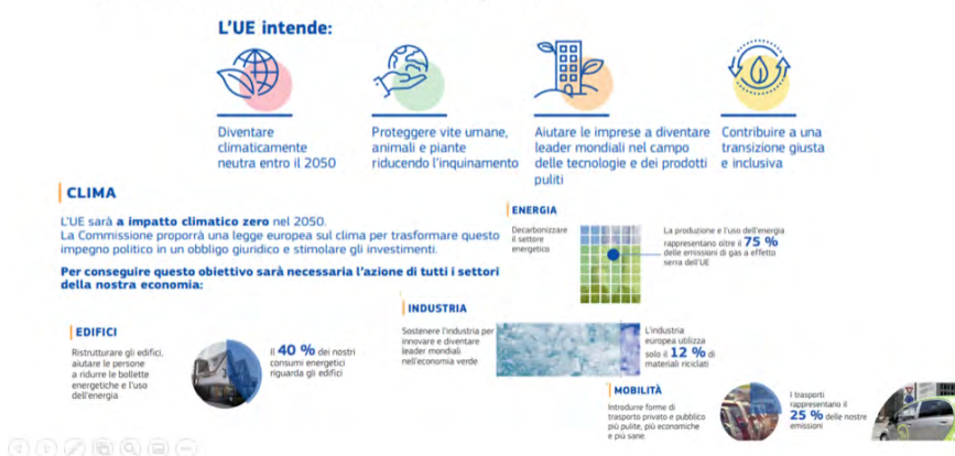
Figura 2: Green Deal europeo in sintesi