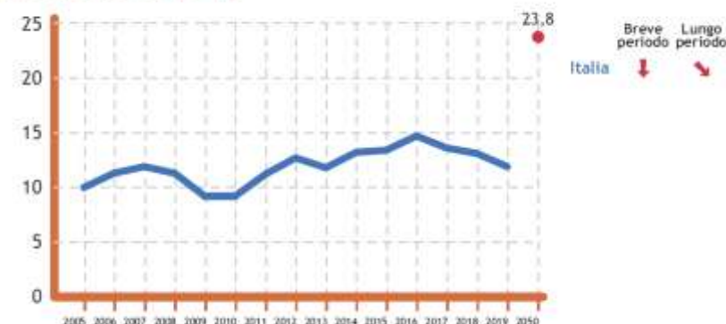
Target 9.1 - Entro il 2050 raddoppiare la quota del traffico merci su ferrovia rispetto al 2019

Per valutare il raggiungimento degli obiettivi quantitativi è stata usata la metodologia Eurostat, che prevede la valutazione dell'intensità e della direzione verso cui l'indicatore si sta muovendo rispetto all'obiettivo prefissato utilizzando delle "freccette".